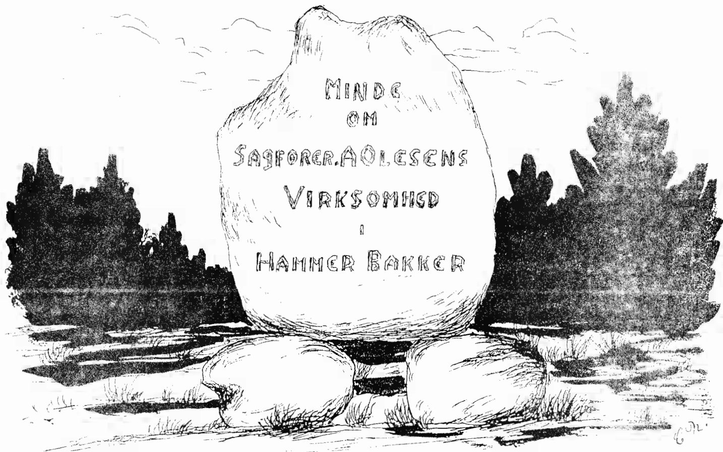
Tegning af Karl Nielsen: Mindestenen på Brødland.