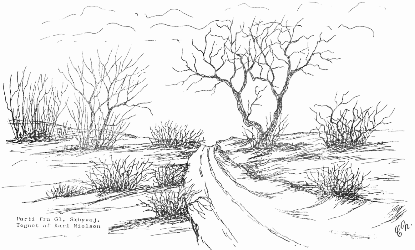
Parti fra Gl. Søbyvej. Tegnet af Karl Nielsen