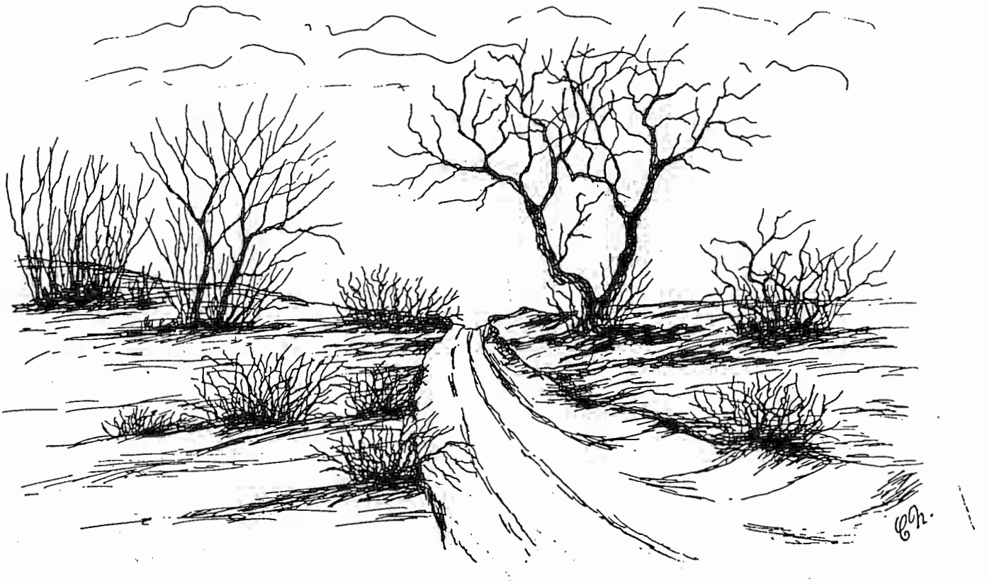
Tuschtegning af Karl Nielsen: Gammel Sæbyvej ved Vodskov, Hammer Bakker.