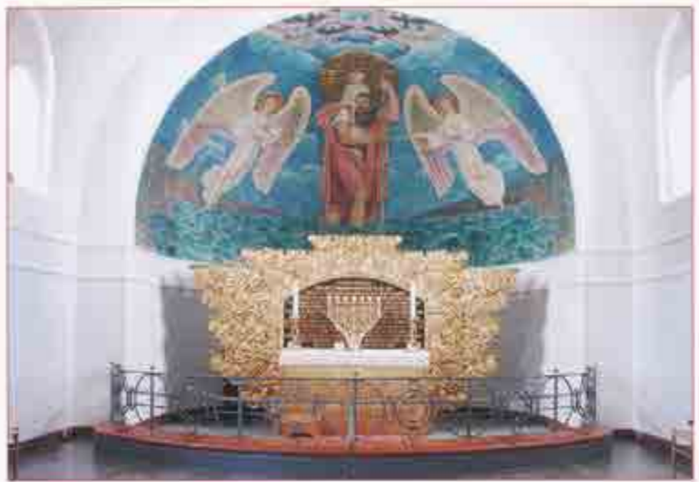
Freskomaleriet efter 100 år.