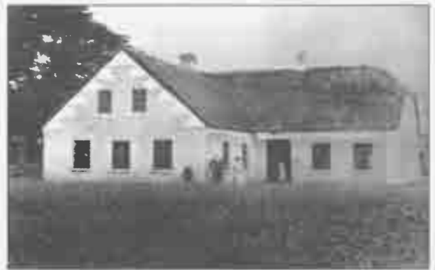
Horsens byskole før 1902