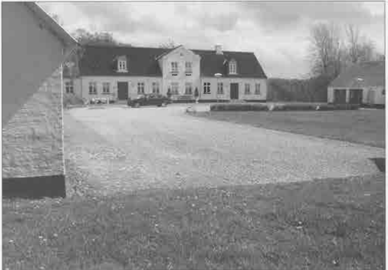
Attrupgård 2009.