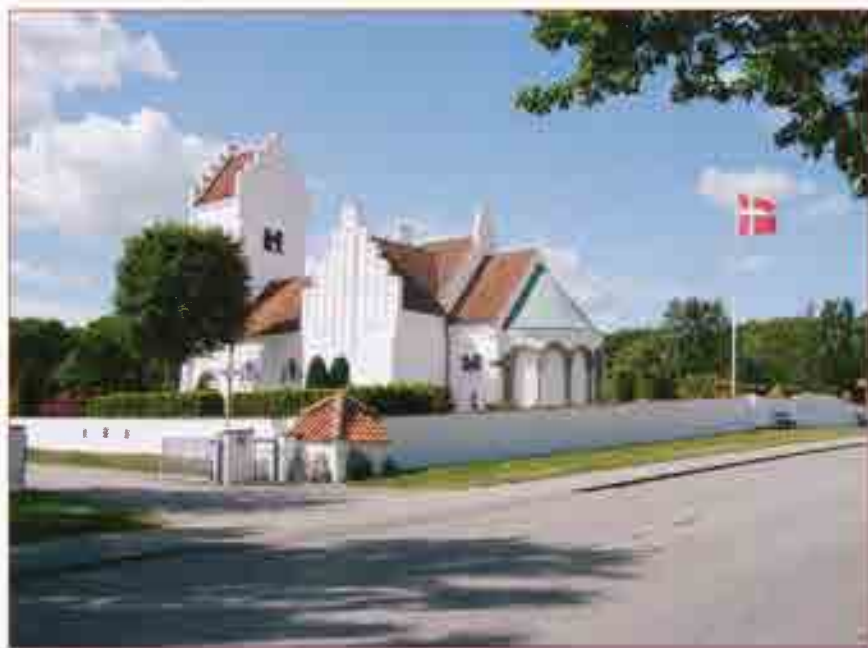
Vodskov kirke juni 2009.

I juni 2009 havde Vodskov Kirke 100-års fødselsdag. Det blev omtalt i dagspressen, og det gjorde indvielsen af kirken i 1909 også: