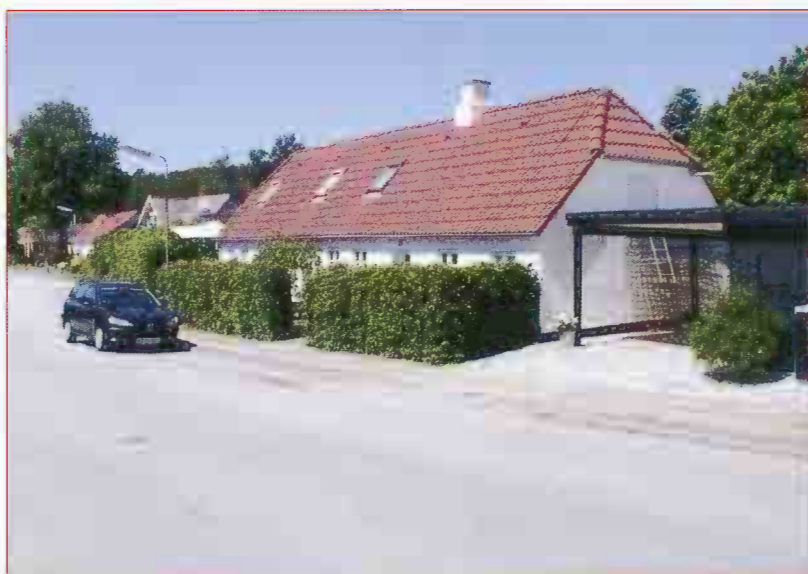
Vodskov Byvej nr. 21 anno 2009