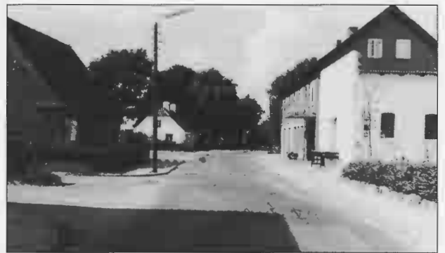
Langholt Brugsforening, Vestvej.

Nu var der ikke flere forretninger, men det skal dog nævnes, at møllen Vester Mølle, eller rettere sagt resterne af den, lå ca. der, hvor den nye vej, Kidholm, starter. Den anden mølle, Øster Mølle, lå der, hvor jeg har bygget hus – Horsens Kirkevej 25. Den var fuldt funktionsdygtig. Jeg bilder mig ind, at jeg har set den køre.