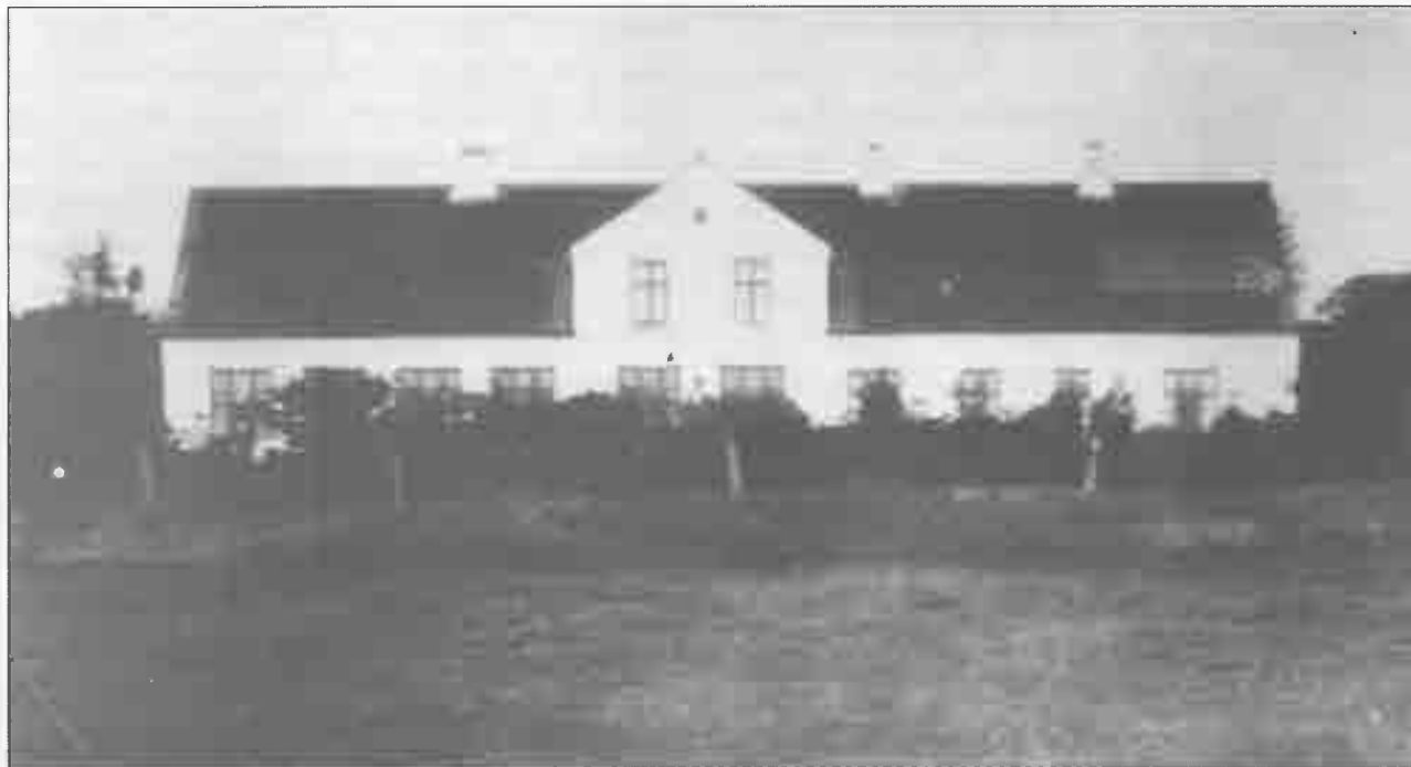
Horsens byskole 1902