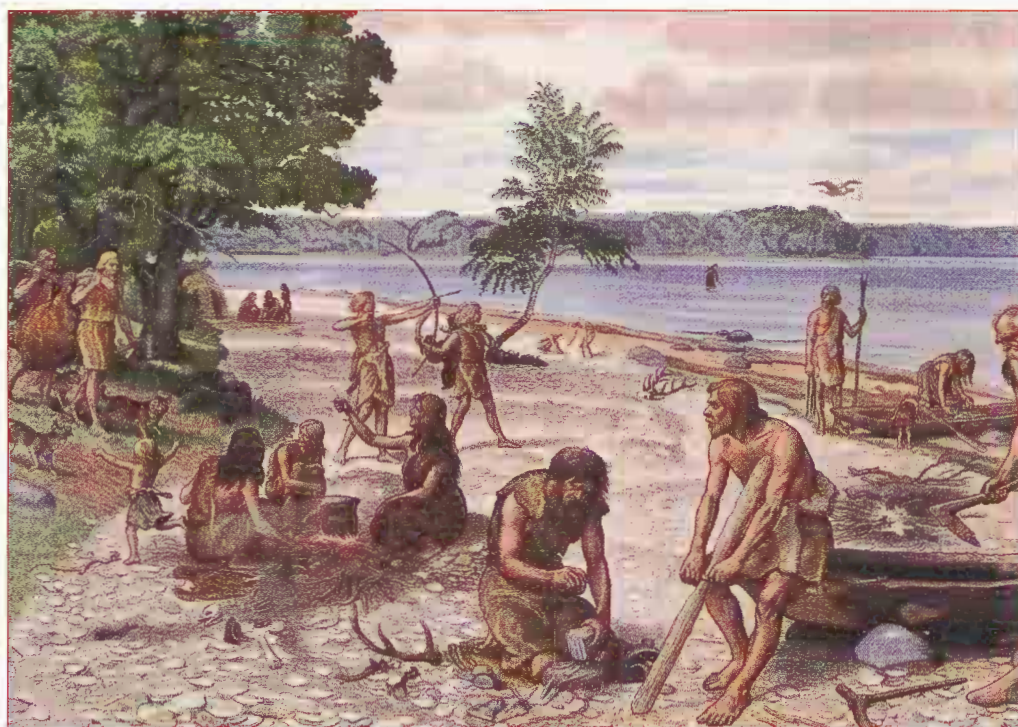
Har Horsens set sådan ud i stenalderen?

Da jeg gravede hul til olietank i 1964, Horsens Kirkevej 9, var der i en dybde af 1,80 meter pælestumper, der tydeligt viste omrids af en hytte. De pæleender, der var i rødderet, havde bevaret deres hårdhed; i sandlaget viste kun en misfarvning deres anbringelse. Jeg fik da lejlighed til at "hilse" på den