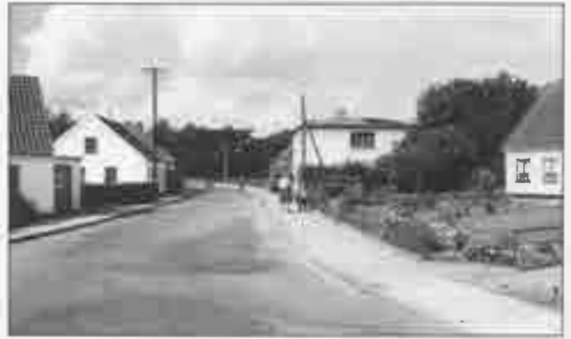
T.h. H.P. Hjelm. T.v. Den gamle Telefoncentral.

På hjørnet af Godtlandsvej, der var den første vej, der blev bebygget, lå der et autoværksted med benzintank. Længere vestpå lå snedkermester Holms