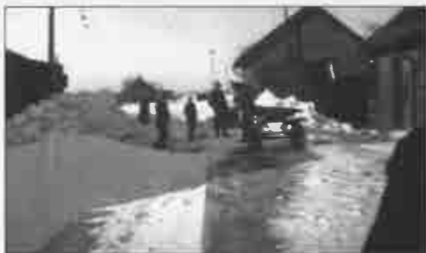
Vodskov Station marts 1942.