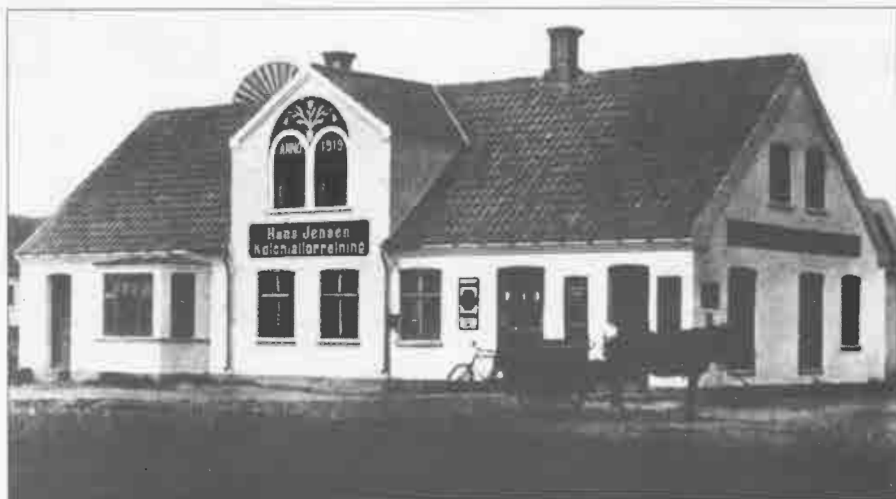
Hans Jensens Kolonialforretning i Uggerhalne Anno 1919.

Samlet indholdsfortegnelse for alle årbøgerne fra 1977 til d.d. bringes hvert 3. år. Næste gang bliver i 2012 udgaven.