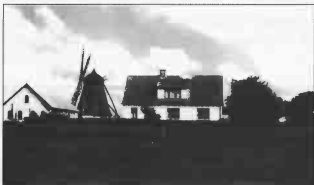
Østre Mølle, Horsens Kirkevej 23.