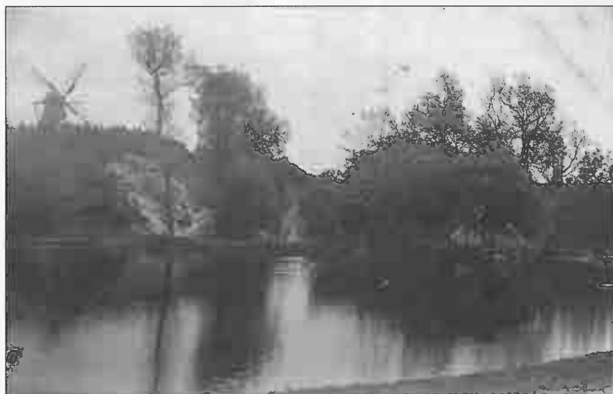
Flamsted Vandmølle & Vindmølle.

Torsdag d. 16. juni 2011 havde "Vodskov Mølle" besøg af medlemmer af Gunderup Sogns Lokalhistoriske Forening. Deres ærinde var at "kontrollere", at vi i Vodskov passer godt på deres mølle.