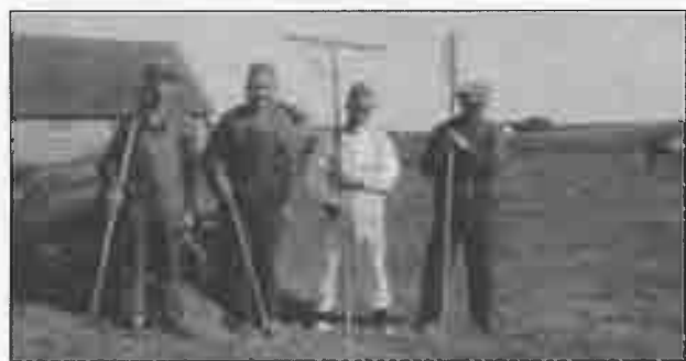
Fra markarbejdet på Attrupgaard.

Stedet blev for alvor et omsorgsbaseret behandlingshjem og arbejdskollektiv i pagt med natur og landbrug og med et klart og eksplicit moralsk grundlag i den indremissionske kristendom.