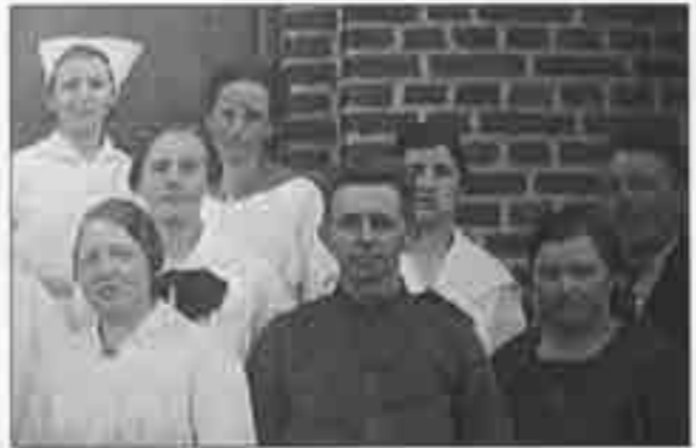
Min far og kollegaer fra institutionen.

tionen for at sørge for varme, vand og elektricitet, så det var ikke særlig praktisk at bo helt nede i byen. Derfor blev der skaffet plads til os i Kvindehjemmet (senere afd. A), hvor vi boede helt oppe under taget. Vi havde her to små værelser. En stue i den ene ende af bygningen og et soveværelse i den anden ende. Vuggen med mig i blev således kørt mellem disse to værelser, forbi alle patientværelserne.