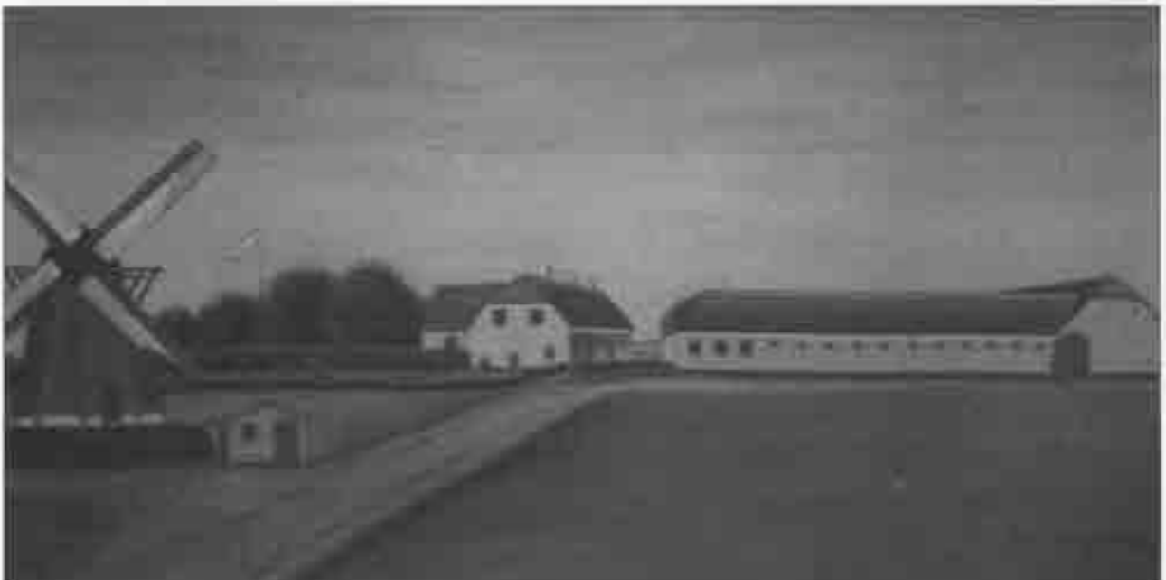
Vestre Mølle i Langholt. Kopi af gl. gårdmaleri fra 1912.

Boligudbygningen i byen fortsætter, men i et langsommere tempo. Rønhøj i byens sydvestlige del bliver byggemodnet, og i den forbindelse åbnes der for en ny udvikling i landsbyen. Der bliver gjort plads til socialt boligbyggeri, og i løbet af få år bygger såvel Lejerbo som Nørresundby