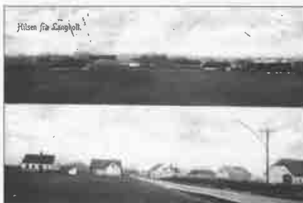
"Hilsen fra Langholt". Postkort sendt 3. februar 1911.

Som det ses, har folketallet de sidste hundrede år været ret konstant, og det selv om der har været et stort boligbyggeri. Mere herom senere.