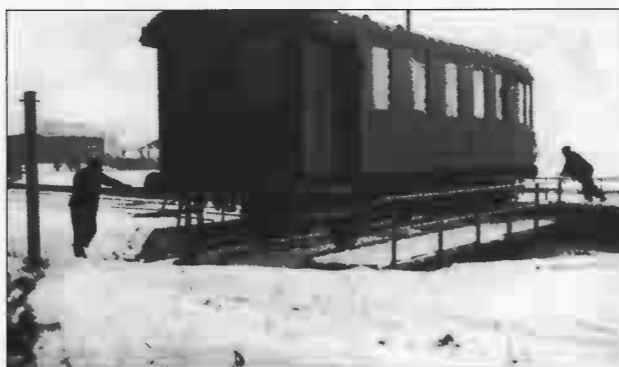
Drejerskiven, hvor motorvognen på Vodskov-Østervrå banen blev vendt, så det kørte "den rigtige vej".