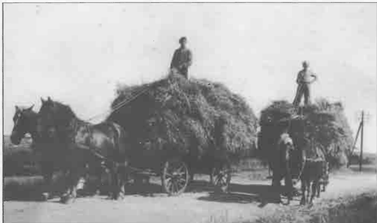
Høstbillede fra gården Striben.