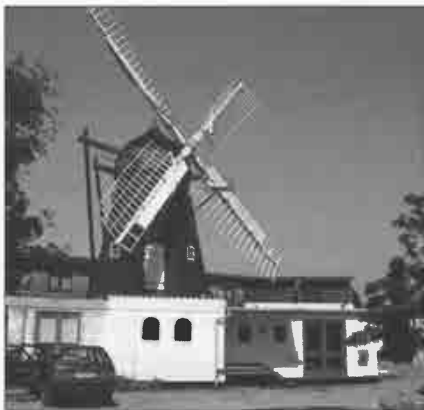
Vodskov Mølle 2007.

Møllen er fuldt funktionsdygtig og fungerer som museumsmølle. (2005)