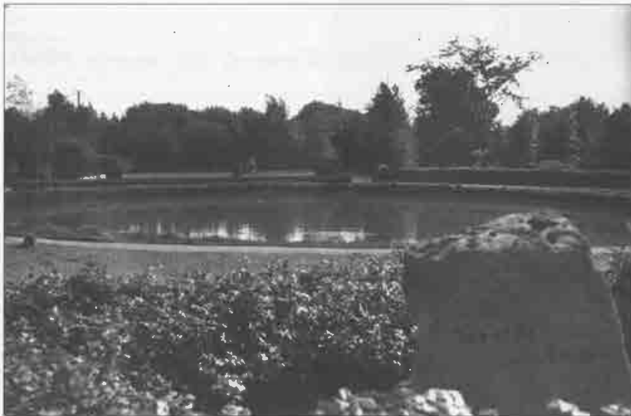
Anlægget i Horsens By sommeren 1935.

Fortsat udvikling af omgivelserne og fritidsmulighederne er afgørende for en landsby i det 21. århundrede, hvor den centrale funktion er at være bosætningsby.