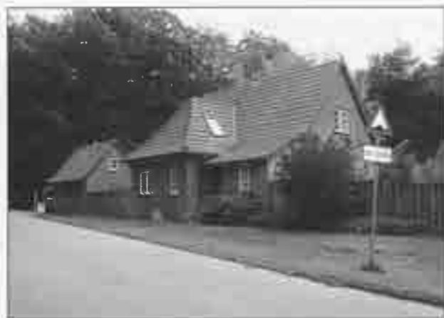
Maskinmesterboligen 2011.

Jeg havde et lille værelse i tagetagen – min søster sov hos mine forældre. Ude bagved var der et lille hus med gammeldags ”das” og vaskehus med gruekedel.