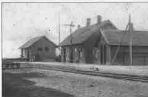
Vodskov Station ukendt årstal.