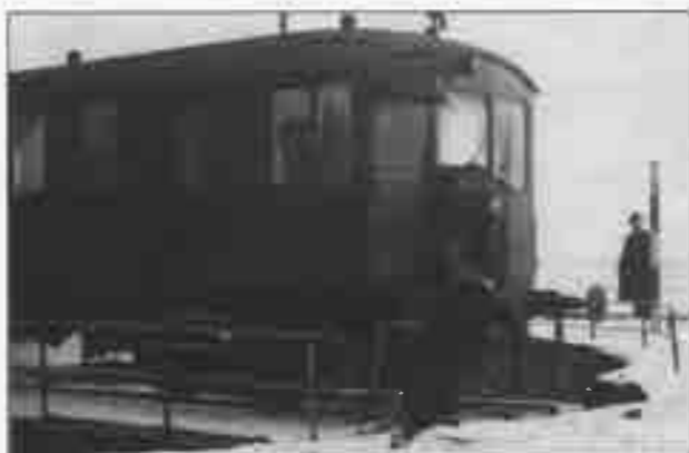
Vodskov-Østervrå Banen VØB blev indviet 21/5-1924 og nedlagt 31/3-1950.