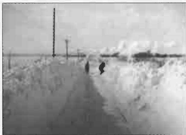
Snevinteren marts 1942. Der skovles sne lidt uden for Vodskov mod Nr. Sundby. I baggrunden røgen fra et ankommende tog.