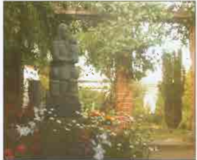
Husets skulpturhave med en række af Jessens egne værker.