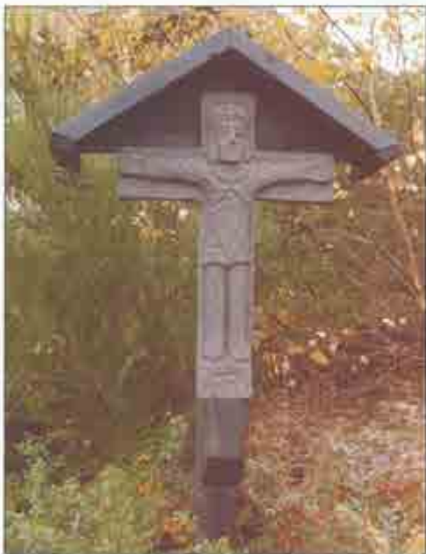
Krusifiks i cement.