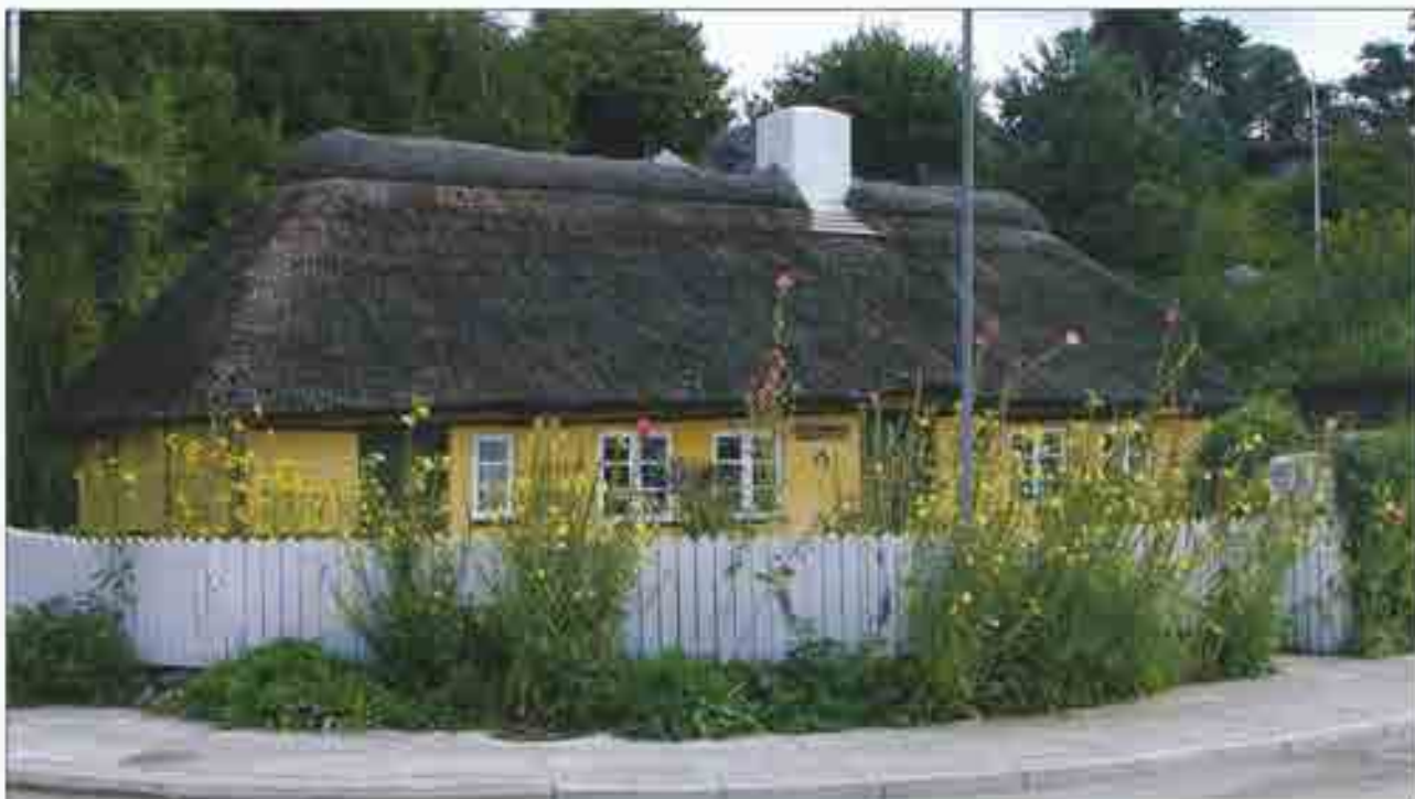
Sommerlig idyl med stokroser og sommerblomster.

årbog måttet lade livet. Alderen havde tæret på træværket. Vi bringer her et par billeder til minde om huset.