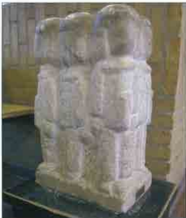
Legende børn. Marmor. Vodskov Skole. Bemærk hvordan de mange kærlige klap gennem årene har færvet hovederne.

og digter, han vil blive husket. Her vises et lille udpluk af hans værker: