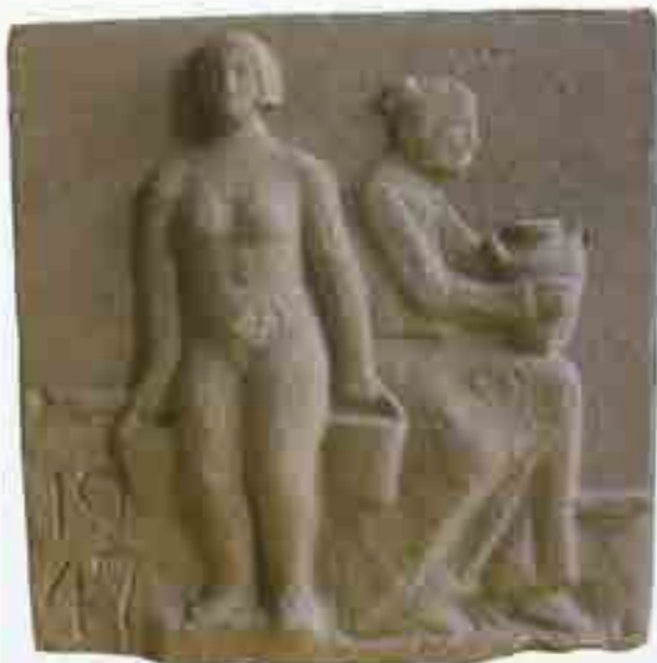
Frise i cement fra Gl. Vodskov nedlagte vandværk.