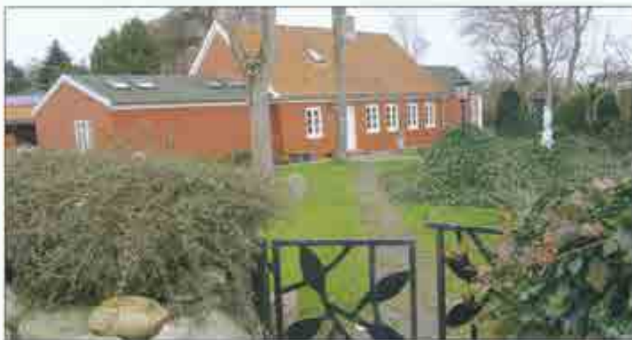
Vodskov Byvej 20 fotograferet d. 21. marts 2014.