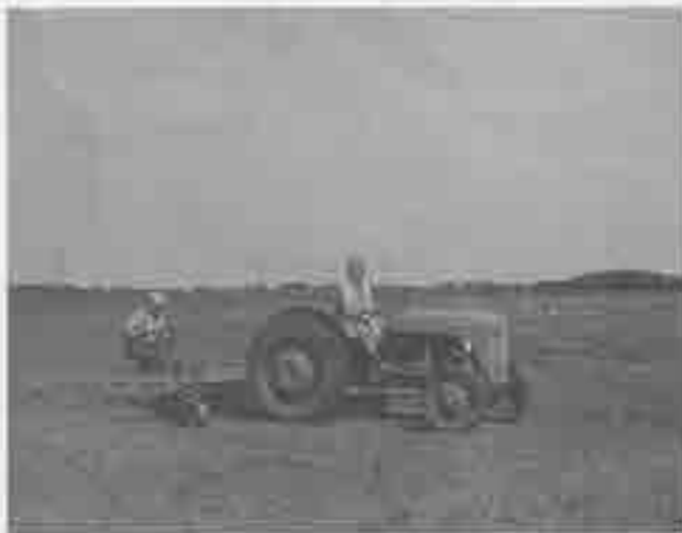
Mine forældre radrenser roer.