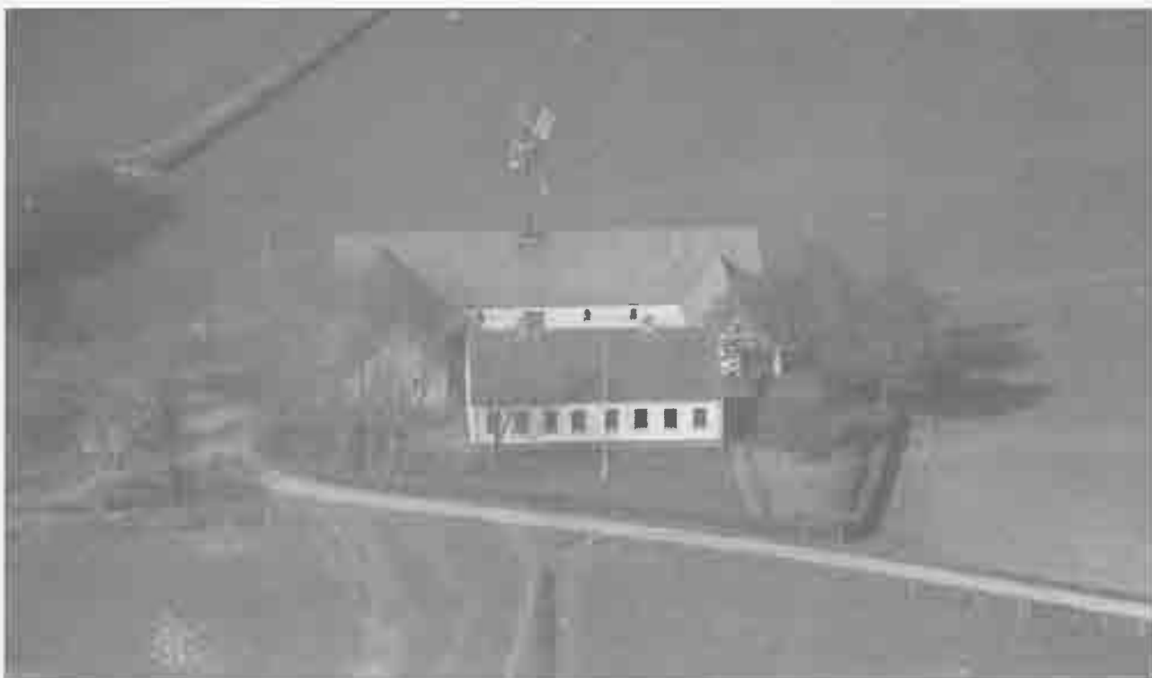
Gården Lerbæk 1948.