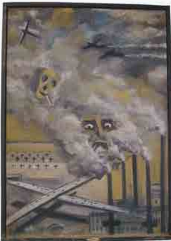
Maleri af forureningskilder.