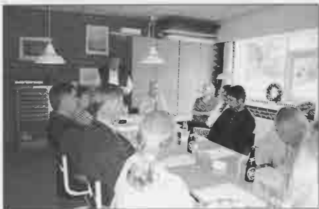
Den sidste generalforsamling.

Først 14/1 – 2003 på en ekstraordinær generalforsamling var der stort fremmøde. Her var eneste punkt på dagsordenen nedlæggelse af frysehuset. Det stod hurtigt klart, at der var stemning for at lukke og slukke per 1/3 – 2003, og sekretæren skriver: ”Et af de sidste andelsfrysehuse i Danmark er lukket. En epoke i madopbevaringens historie er besejlet.”