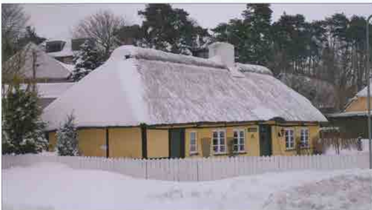
Bedstefars Hus en kold vinterdag i 2007.