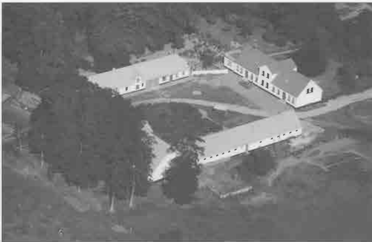
Attrupgaard. Udateret kopi af luftfoto.