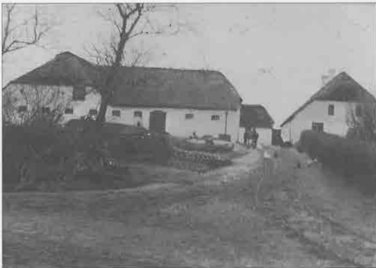
Lerbæk omkring år 1900.

Når der var royalt besøg gennem årene med Dannebrog, blev flaget hejst, når vi øjnede skibet ved Nordjyllandsværket. Det var lige før, at min far også mente, at det var bedst at have fint tøj på – denne skik har vi fastholdt – i hvert fald med hensyn til flaget!